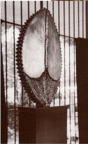
Ludwig Haas erschafft seine Metallplastiken als Abstraktionen menschlicher Befindlichkeiten und Seelenzustände. Mit einer besonderen Schmelztechnik gewinnt er aus Rohlingen neue wuchtige Formen.